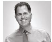
Michael Dell DELL