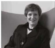
Avivah Wittenberg-Cox INSEAD